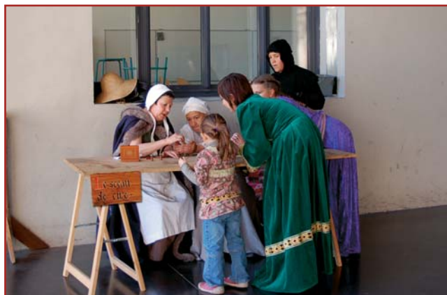
A l'atelier sceau d'argile.