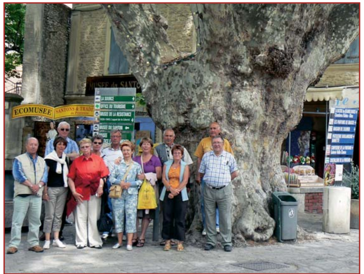
Halte rafraîchissante à Fontaine-de-Vaucluse.