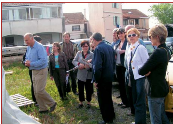
Commentaires devant la presse à mouton.