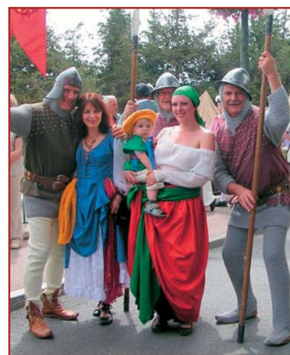
Soldats en goguette...

Les 31 mai et 1 er juin 2008, le village renaissance a ouvert ses portes pour deux journées fantastiques. Une délégation des Médiévales a participé à différents défilés dans les ruelles fleuries, pleines de charme et de saveur, programmés tout au long de la journée, entre musique et danse. Et pour clore la journée, le spectacle son et lumière, sur les berges du Loup nous a offert un rôle de figurants que le metteur en scène nous a expliqué rapidement. Le thème : « ce village tranquille sera perturbé par les ambitions guerrières des puissants de l'époque... jusqu'à l'arrivée du Bon Roi François ». Excellente journée due à la visite dans nos ateliers, lors de la journée « Portes Ouvertes », de trois responsables de l'Association François 1 er .