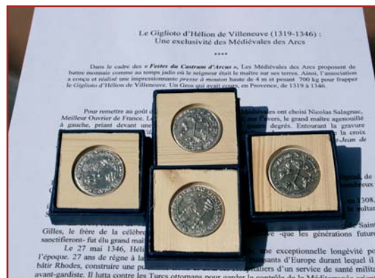
Le Giglioto fêliche. (Photo P.C.)

Les participants à cette frappe exceptionnelle. (Photo P.C.)