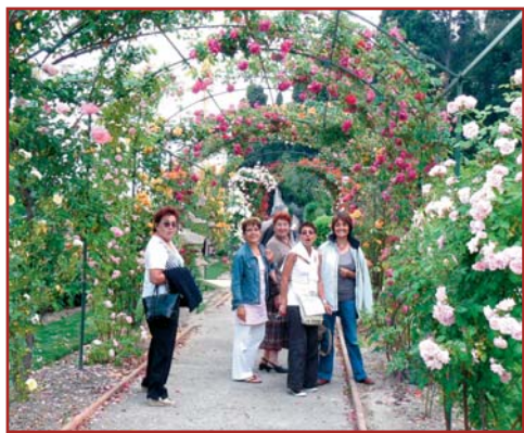
A la roseraie du monastère franciscain.