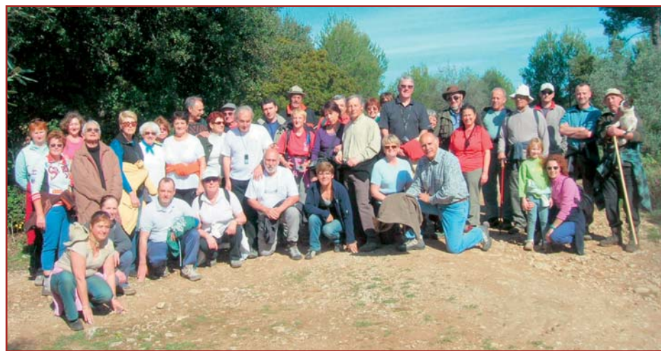
Le groupe des marcheurs engagé sur le chemin médiéval de La Motte à Flayosc.