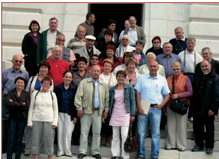
Sur les marches de l'Observatoire.