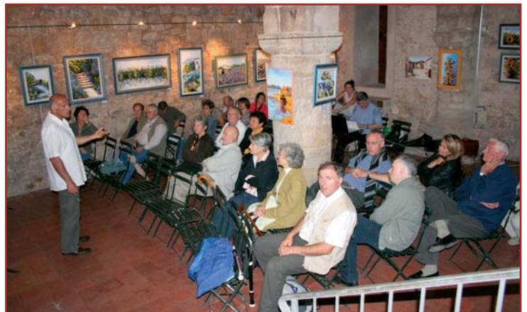
Présentation de la conférence.