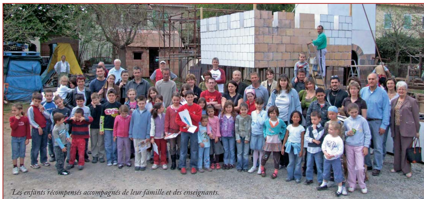
Les enfants récompensés accompagnés de leur famille et des enseignants.

Puis hôtes et invités partageaient le verre de l'amitié sous un soleil estival.