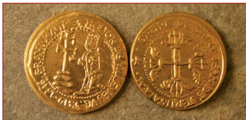
L'avvers et le revers du Giglioto.

Et ce, pour 3 € seulement, vin hypocras de l'amitié compris !