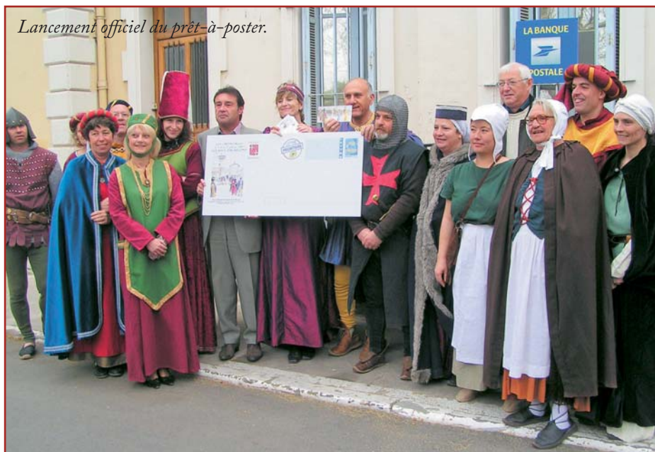
Lancement officiel du prêt-à-poster.

L'intérêt manifesté par tous les présents à l'enveloppe millésimée et à la carte postale « Orient en Terre d'Arcus » laisse supposer que les œuvres dessinées